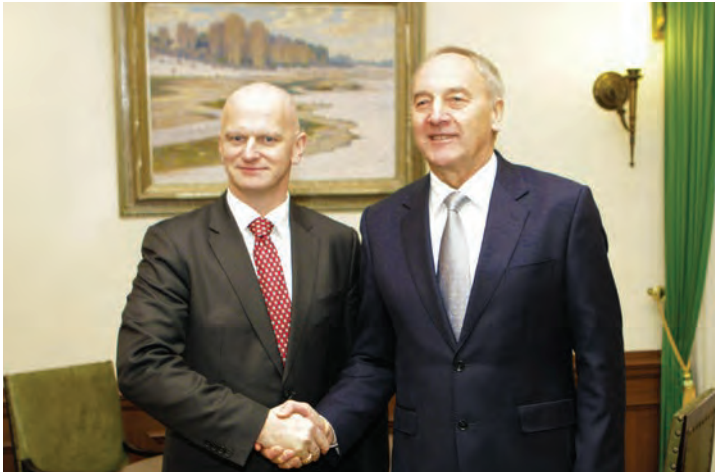
22. decembris 2011. Tieslietu ministra tikšanās ar Latvijas Valsts prezidentu jautājumā par demokrātiju un tiesiskumu referendumu rīkošanu. Sarunā tieslietu ministrs uzsvērs valsts pamatu negrozāmību.

Tika iesniegti grozījumi likumā „Par valsts