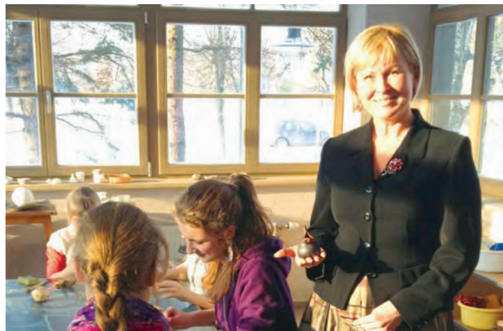
27. janvārī reģionālās vizītes ietvaros kultūras ministre viesojas Kultūras un humanitāro zinību vidusskolā.

Pilnveidota Latvijas Nacionālās bibliotēkas (LNB) celtniecības projekta uzraudzība – izstrādāts un saskaņots detalizēts veicamo darbu grafiks. Tāpat izsludināti iepriekš mēnešiem iekāvētie iepirkumi infrastruktūras būvdarbiem, lai